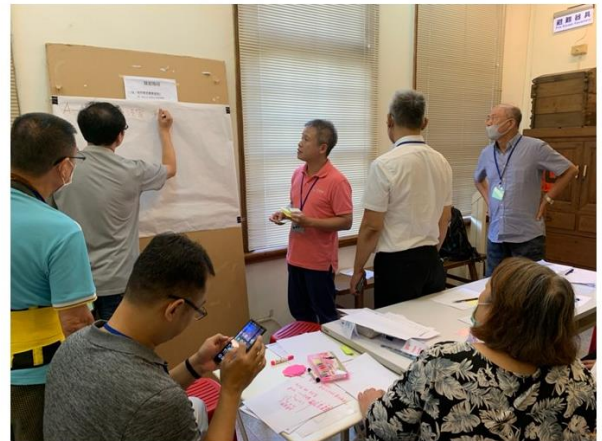
臺北市都市再生學苑 x 都市更新重建教育訓練 輔導自主更新跨域工作坊/109.08.09