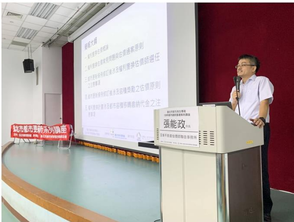
臺北市都市再生學苑 x 都市更新重建系列講座 權利變換估價與審議通案常見問題/109.08.15