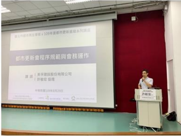
臺北市都市再生學苑 x 都市更新重建系列講座 都市更新會程序規範與會務運作/109.08.29