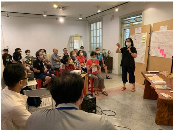
臺北市都市再生學苑 x 都市更新重建教育訓練 輔導自主更新跨域工作坊/109.08.02