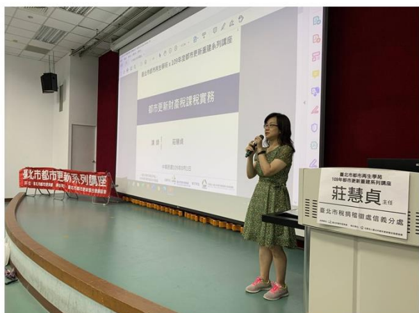
臺北市都市再生學苑 x 都市更新重建系列講座 都市更新稅捐法令與實務課題/109.08.01