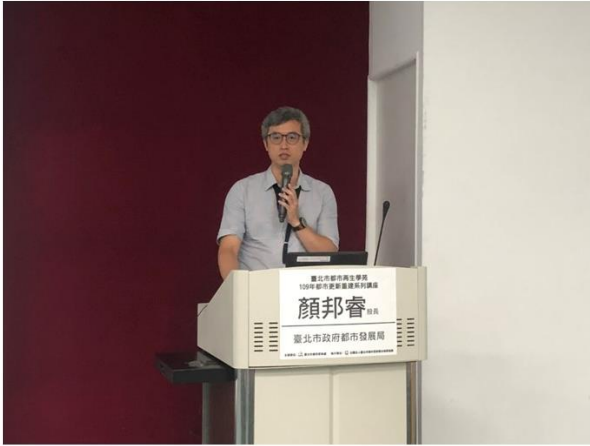
臺北市都市再生學苑 x 都市更新重建系列講座 臺北市都市發展法令與都市更新之常見問題/109.08.05