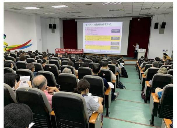
臺北市都市再生學苑 x 都市更新重建系列講座 國有土地參與民辦都市更新規定與注意事項/109.08.19