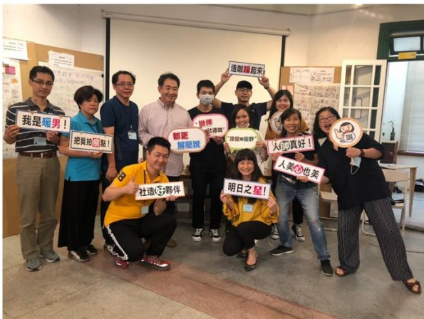
臺北市都市再生學苑 x 都市更新重建教育訓練 輔導自主更新跨域工作坊/109.08.09