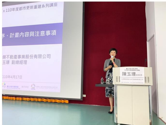
臺北市都市再生學苑 x 都市更新重建系列講座 臺北市都市更新推動程序要點/110.04.17